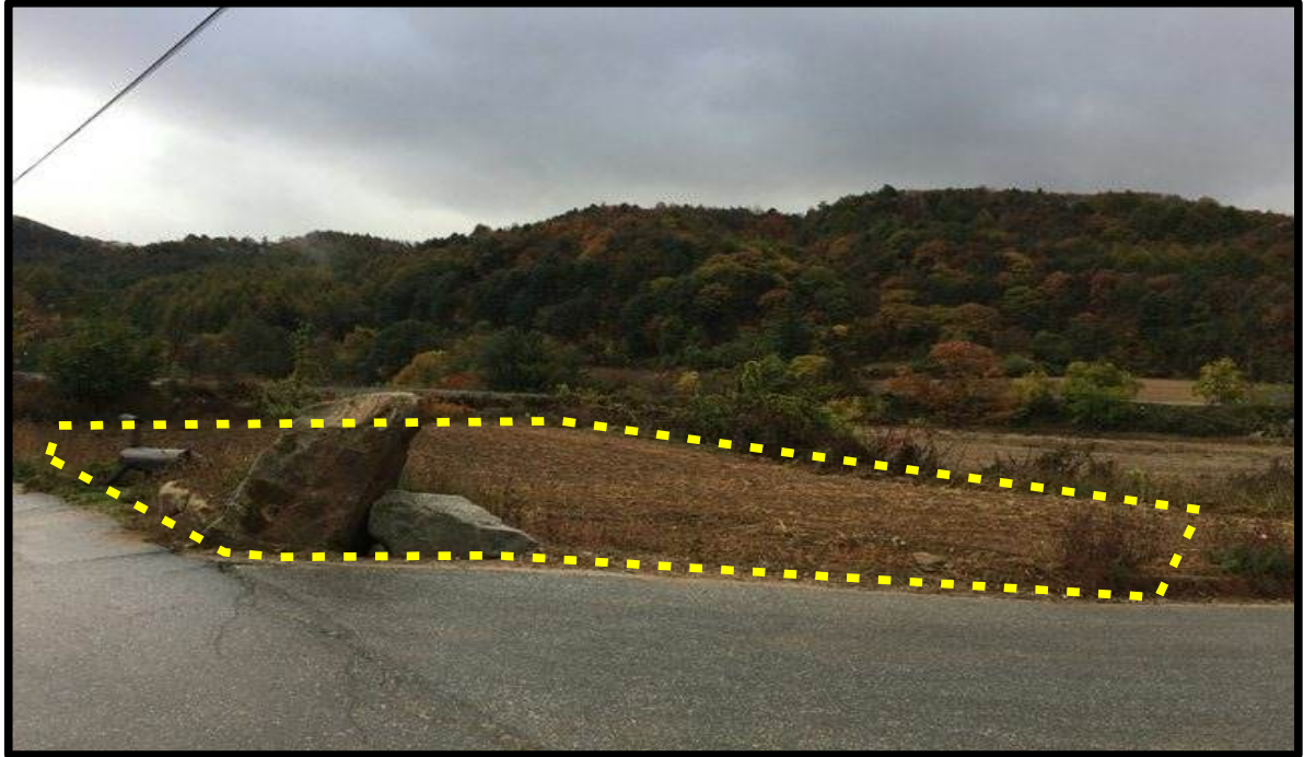
봉평면 창동리 639번지(진입부 삼거리)