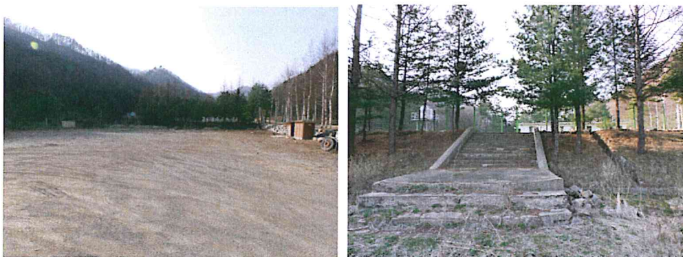
< 인근 공유지 >