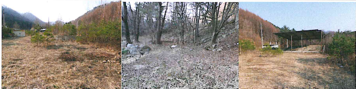
< 국방부 토지 >