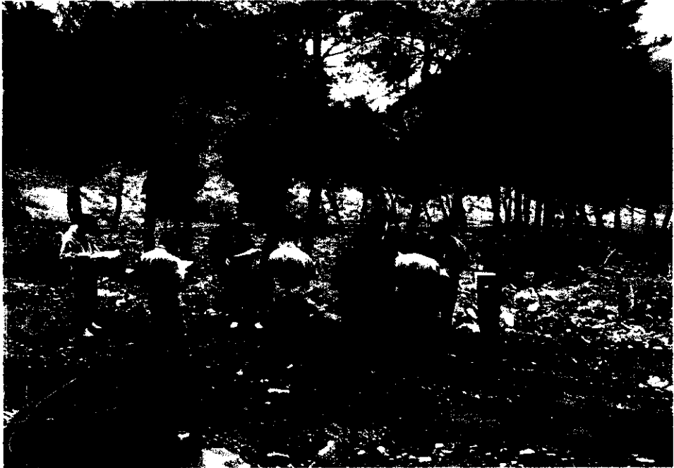
<< 불법현장 >>