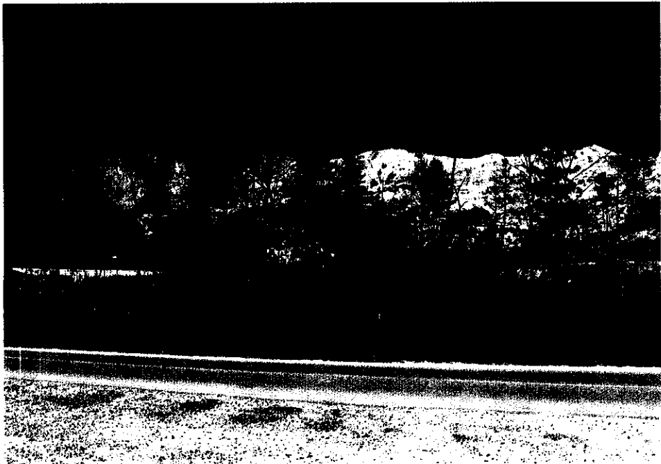
<< 봉평면 무이리 임 277-4번지 >>