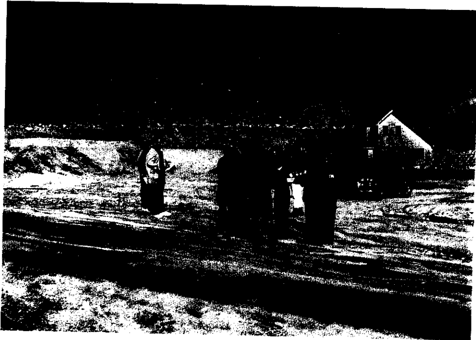
<< 봉평면 무이리 산 175번지 일대 >>