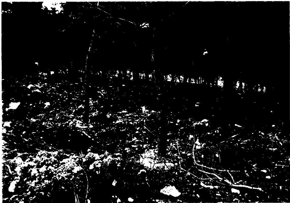
<< 임목이동을 위해 작업현장 >>