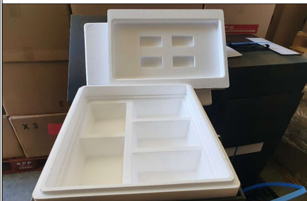
선물세트 - 5구 아이스박스 및 외장박스