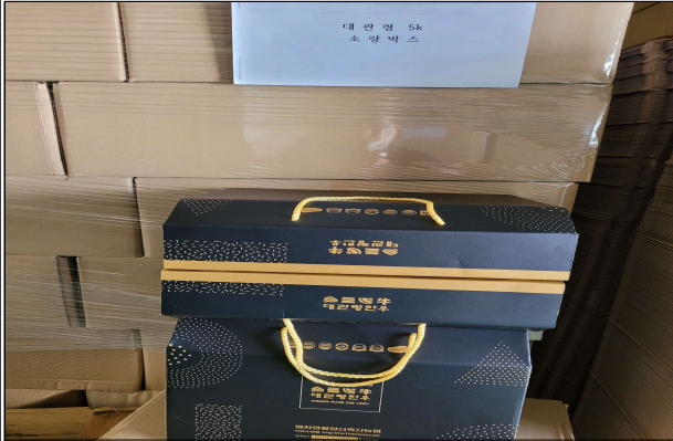
선물세트 - 선물박스 5kg