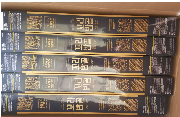
부산물 포장자재 - 꼬리반골 포장재(띠지)