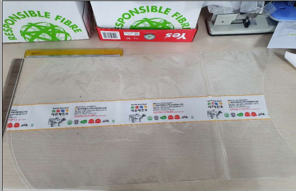
진공수축포장재 - 진공필름(450*750)