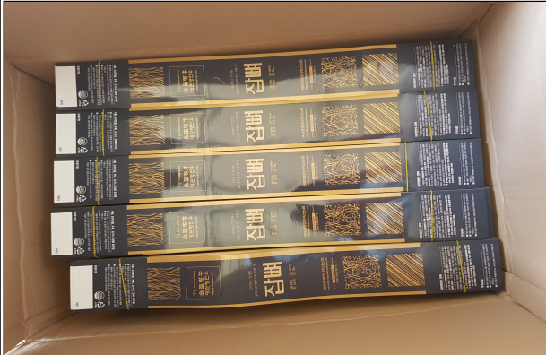
부산물 포장자재 - 잡떡 포장재(띠지)