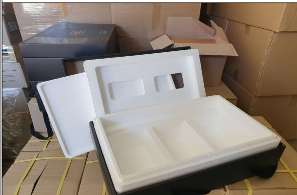
선물세트 - 3구 아이스박스 및 외장박스