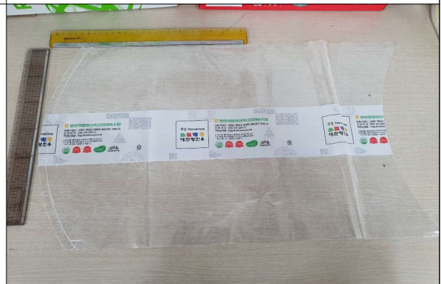
진공수축포장재 - 진공필름(350*450)