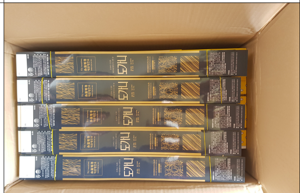
부산물 포장자재 - 도가니 포장재(띠지)