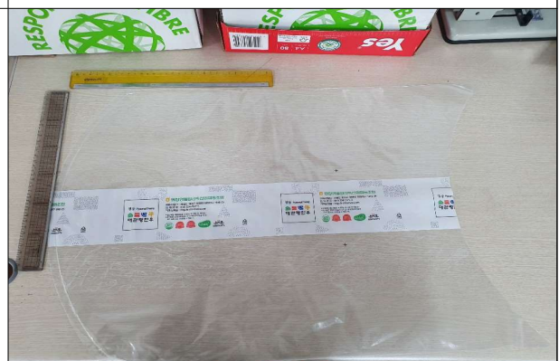
진공수축포장재 - 진공필름(450*550)