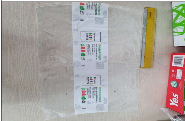
진공수축포장재 - 진공필름(250*550)