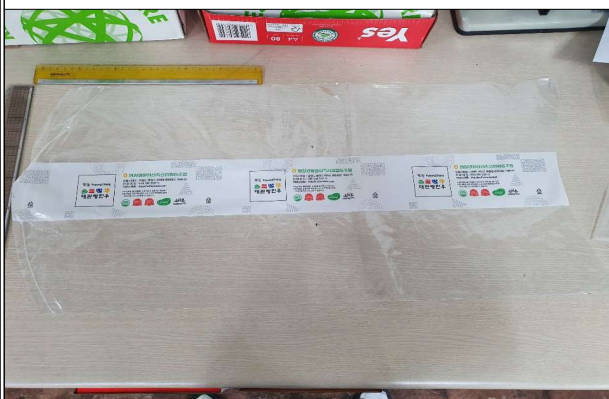
진공수축포장재 - 진공필름(350*700)