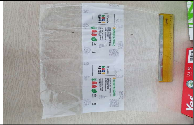
진공수축포장재 - 진공필름(250*450)