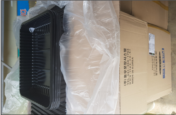
부산물 포장자재 - 부산물 용기(스킨7kg)