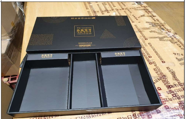
선물세트 - 육포곰탕혼합박스