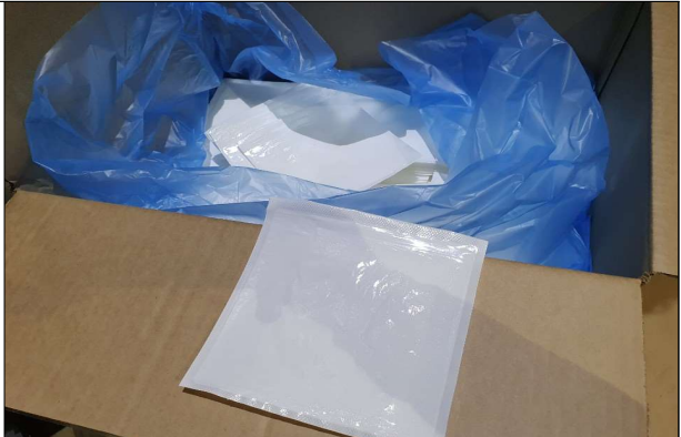
진공수축포장재 - 흡수패드