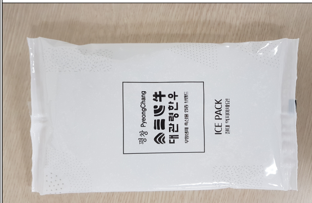
아이스팩 - 500g