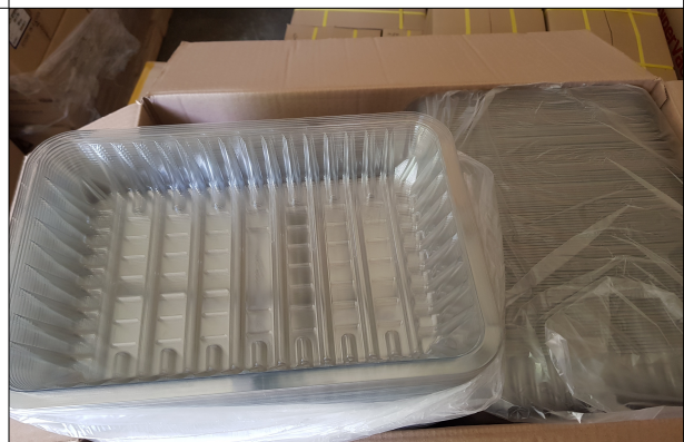
부산물 포장자재 - 부산물 용기(TC600)