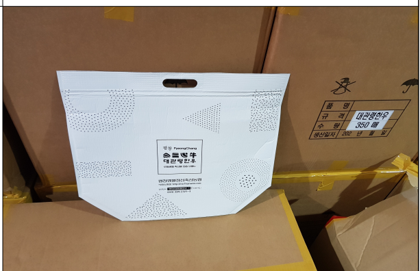
선물세트 - 보냉가방