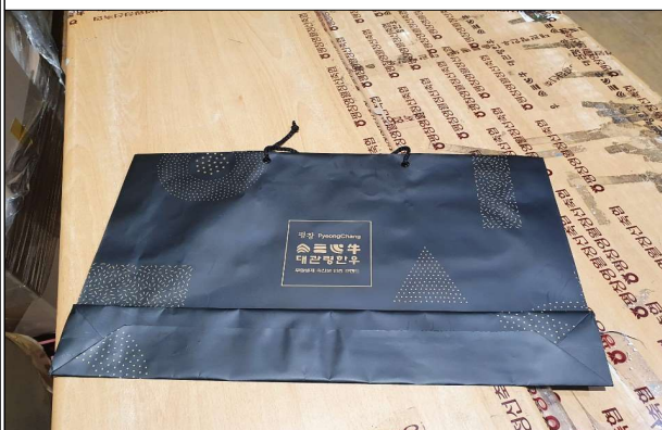
선물세트 - 육포곰탕혼합쇼핑백