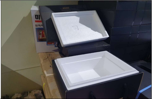
선물세트 - 2구 아이스박스 및 외장박스