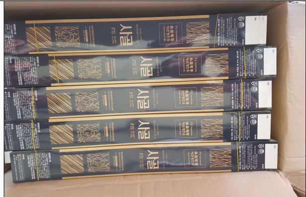
부산물 포장자재 - 사골 포장재(띠지)